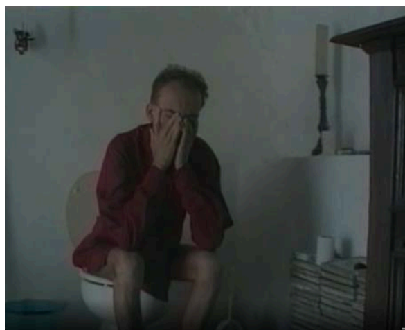
Fig. 4 ib.