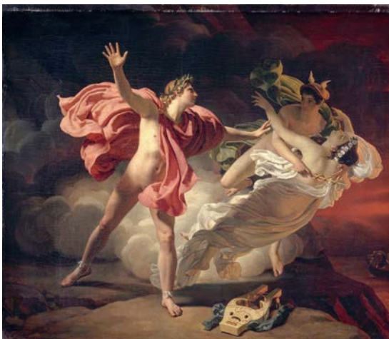
Fig. 1 Orphée et Eurydice 2

muerte, a su vez, la encargada de señalar los límites de esas vivencias, de arrebatarse al amor su promesa de infinidad y resignificar así lo que implica su experiencia. Ambos aspectos han sido ampliamente representados a lo largo de la historia del arte ya que, tratados desde un punto de vista puramente alegórico, conllevan una carga extremadamente poética. Charles Segal se refiere a ello en Orpheus: The Myth of the Poet –en cuanto a las interpretaciones del mito realizadas por Virgilio y Ovidio–, donde se establece una triangulación visual en la que cada elemento funciona como vértice: «amor-muerte, amor-arte y arte-muerte» (1989, p. 2). Tal y como se puede extraer de la reflexión de Segal, el viaje órfico no simboliza sino la esencia misma de la poesía, a través del enfrentamiento de amor y muerte como fuerzas fundamentales en los procesos de creación o frustración artística. Las reconstrucciones pictóricas del mito también se construyen en torno a esta relación de conceptos, representando a una Eurídice que se desvanece entre los brazos de su amante o a un Orfeo incapaz de rescatarla en su caída a los infiernos. Se trata de la muerte que arrebató el amor y del amor que se niega a sucumbir ante la muerte. Entre los enamorados y la muerte permanece siempre el tercer vértice, el arpa, la herramienta del poeta que puntualiza la metáfora.