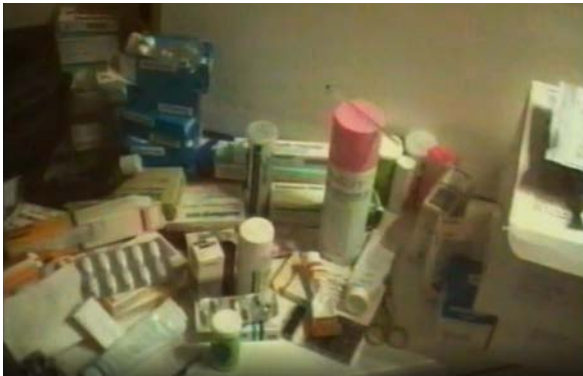
Fig. 9 La Pudeur ou l'Impudeur

hace, gracias a la voluntad creadora de la cámara que desde la distancia está escribiendo la historia del cineasta a través de su cuerpo.