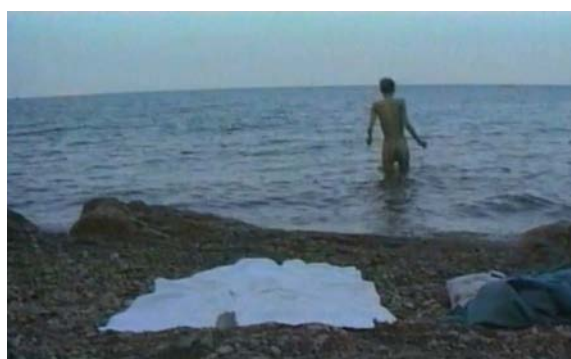
Fig. 23 La Pudeur ou l'Impudeur