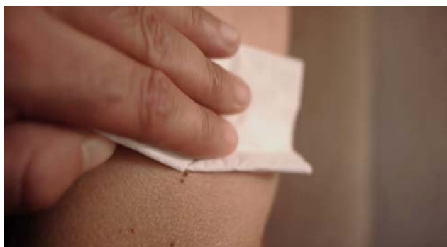
Fig. 24 E agora? Lembra-me