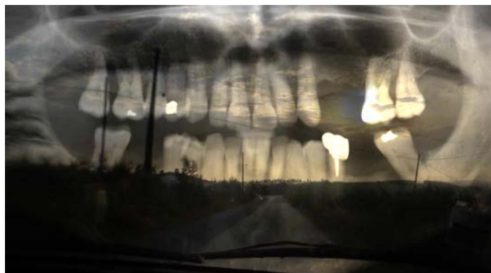
Fig. 5 E agora? Lembra-me

Cada imagen pasa entonces por el cuerpo y el gesto, principalmente a través de esa idea anteriormente mencionada del “yo-cámara”. Pero en su caso, la expresividad del dispositivo cinematográfico va un paso más allá y el gesto de la mano del cineasta se evidencia, con más fuerza si cabe, también sobre la mesa de montaje, donde cada decisión pasa nuevamente por el cuerpo. A través de un exhaustivo trabajo de acumulación y asociación de una gran diversidad de imágenes y materiales, tanto grabadas por él mismo como de archivo encontrado o re-apropiado, Joaquim Pinto constela su imaginario del enfermo. Como montador de su propia película, quizás el principal gesto de montaje más que el “corte” de los cuerpos sea su superposición. A través de la utilización de las opacidades el director busca poner en diálogo distintas dimensiones o capas narrativas. Respecto al cuerpo, destaca su representación de la dimensión del dolor físico.