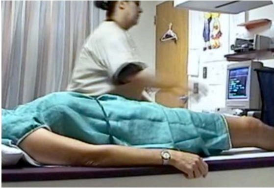
Fig. 15 ib.