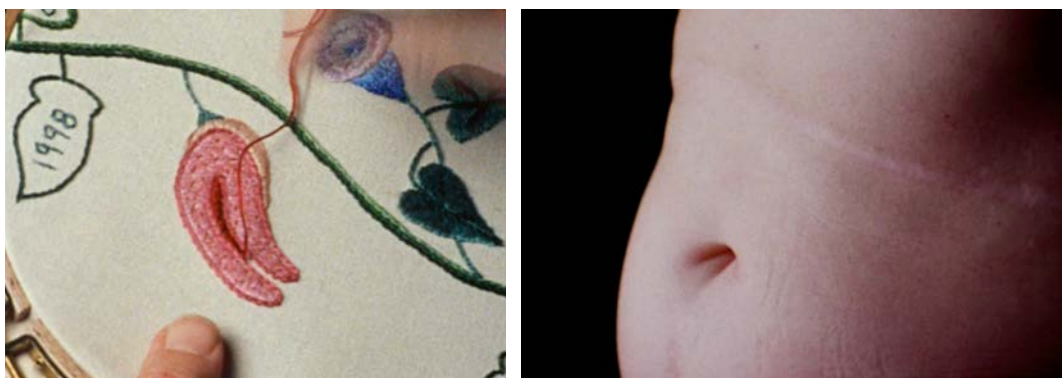
Fig. 13, 14 The Odds of Recovery