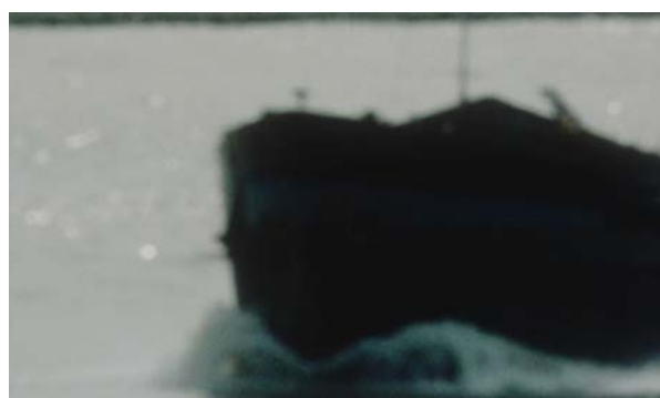
Fig. 22 The Long Holiday

La última escena de The Long Holiday es el mejor caso para ejemplificar el final del viaje del enfermo, el cierre o punto final de la despedida, representado en esta dinámica de distancias cercanas y lejanas. La obra termina con el cineasta frente al mar, como en el caso de Guibert, aunque como ocurre a lo largo de toda la película aquí no hay rastro del cuerpo del cineasta, ya que todo el “yo” está esencializado en la mirada a través de la subjetividad de la cámara. Mientras escuchamos las últimas notas de un saxofonista sin aliento esta trata de focalizarse en el mar, primero a través del plano paisaje y el horizonte para, a medida que la abstracción aumenta por el tiempo de la contemplación, pasar a representar el paisaje en sus detalles. Sobre la textura de las olas y los barcos las imágenes comienzan a desenfocarse, produciéndose una distorsión o desfiguración iconográfica. Es el desvanecimiento de lo real, remite a la pérdida de los sentidos, al último esfuerzo para cerrar la película. La mirada del cineasta se agota y se apaga por la enfermedad, su capacidad de capturar el mundo a través de la experiencia sensible llega a su fin y, con ella, las imágenes inician un proceso de desaparición, borrándose lentamente ante el espectador, como si los ojos que las miran estuviesen, finalmente y para siempre, cerrándose. Es la última mirada de amor y de vida, el último adiós.