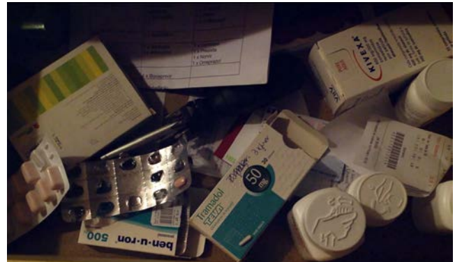
Fig. 10 E agora? Lembra-me