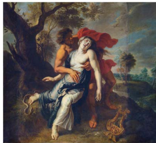
Fig. 2 La muerte de Eurídice 3

Más allá del carácter prácticamente omnipresente de la alegoría «amor-muerte» en el arte, que parece situarse en una esfera mágica e insólita, destaca en la experiencia cotidiana un único fenómeno biológico capaz de difuminar la fina línea entre estos dos estados o tendencias. En El nacimiento de la clínica: una arqueología de la mirada médica , Foucault escribe: «No es que el hombre muera porque ha caído enfermo; es, fundamentalmente, porque puede morir, por lo que llega el hombre a estar enfermo», concluyendo que «la muerte, es la enfermedad hecha posible en la vida» (2001, p. 220). La enfermedad, siempre concebida desde una hermenéutica del umbral (Beuchot, 2003 4 ), asalta al individuo de forma