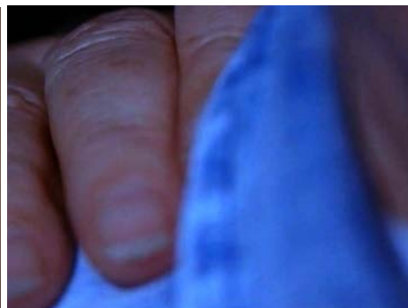
Fig. 25 Jacquot de Nantes