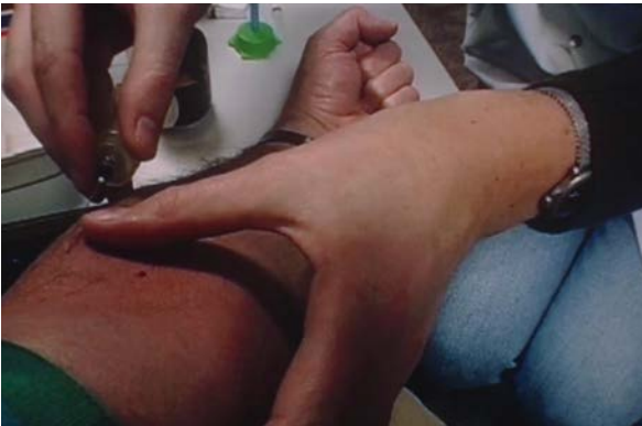
Fig. 11 The Long Holiday