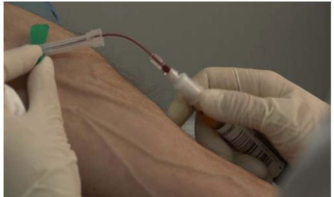
Fig. 12 E agora? Lembra-me

Quizás la película que mejor representa la apropiación de lo clínico sea The Odds of Recovery (2002), de la cineasta estadounidense y vanguardista Sue Friedrich. La cineasta establece la relación entre lo clínico y lo autobiográfico o lo íntimo de forma evidente planteando la película como un diario de la enferma, en el que la palabra opera no sólo a través de la voz en off sino también del texto, estableciendo con intertítulos una cronología de vida estructurada en base a sus diferentes operaciones a lo largo de los años: «Operation number one: Novembre 20, 1977, age 22» (Friedrich, 2002) es la primera de una larga lista. El documental es una continua sucesión de visitas a la consulta médica, en las que somete su cuerpo a diferentes pruebas radiológicas y electromagnéticas. Sentada en multitud de camillas, el cuerpo de Friedrich es inspeccionado y manipulado por diferentes facultativos, figuras con batas a las que apenas vemos. Es una imagen idéntica a la que se produce también en La Pudeur ou l'Impudeur de Hervé Guibert y en The Long Holiday de Johan van der Keuken, la del contraplano del cineasta con el doctor, separados por una mesa que indica a cada uno cuál es su posición en relación a la enfermedad, uno diagnostica, el otro se muere. En el plano del médico de La Pudeur ou l'Impudeur su rostro está difuminado, no es necesario, sólo la fatalidad de la información que proporciona. De esas interacciones son de la que los