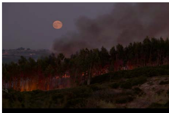
Fig. 20, 21 E agora? Lembra-me

La última escena de The Long Holiday es el mejor caso para ejemplificar el final del viaje del enfermo, el cierre o punto final de la despedida, representado en esta dinámica de distancias cercanas y lejanas. La obra termina con el cineasta frente al mar, como en el caso de Guibert, aunque como ocurre a lo largo de toda la película aquí no hay rastro del cuerpo del cineasta, ya que todo el “yo” está esencializado en la mirada a través de la subjetividad de la cámara. Mientras escuchamos las últimas notas de un saxofonista sin aliento esta trata de focalizarse en el mar, primero a través del plano paisaje y el horizonte para, a medida que la abstracción aumenta por el tiempo de la contemplación, pasar a representar el paisaje en sus detalles. Sobre la textura de las olas y los barcos las imágenes comienzan a desenfocarse, produciéndose una distorsión o desfiguración iconográfica. Es el desvanecimiento de lo real, remite a la pérdida de los sentidos, al último esfuerzo para cerrar la película. La mirada del cineasta se agota y se apaga por la enfermedad, su capacidad de capturar el mundo a través de la experiencia sensible llega a su fin y, con ella, las imágenes inician un proceso de desaparición, borrándose lentamente ante el espectador, como si los ojos que las miran estuviesen, finalmente y para siempre, cerrándose. Es la última mirada de amor y de vida, el último adiós.