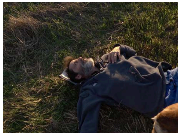
Fig. 19 E agora? Lembra-me