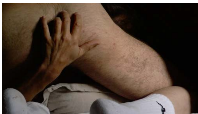
Fig. 8 E agora? Lembra-me

La visión desolada de Guibert en cuanto al amor o el deseo como sufrimiento y culpa se contrapone a la de Pinto, que se reconforta en los cuidados y el acompañamiento de un viaje conjunto. De esta forma, el cuerpo del “otro” es esquivo o eludido en La Pudeur ou l'Impudeur mientras en E Agora? Lembra-me está siempre presente, dentro y fuera del plano, al lado del cineasta.