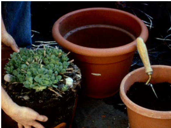
Fig. 18 The Odds of Recovery

cuidado de la tierra, cuidan también de sí mismos. En The Odds of Recovery Friedrich alterna las cirugías y los exámenes médicos con la creación de un pequeño jardín en el patio de su casa, que le sirve para reflexionar sobre el proceso de su propia recuperación. Traslada la metodología de la jardinería, basada en la paciencia, al trato que debe mantener consigo misma para evitar caer en la desesperanza de los tiempos de espera y la ferocidad de lo clínico. En el caso de Joaquim Pinto, el tiempo de la sanación también se intercala con el del tratamiento, planteando así dos temporalidades contrapuestas y espaciales en la película, Madrid y Lisboa. En este segundo espacio Pinto y Nuno tienen una casa en la montaña, allí, como Friedrich, se cuidan mutuamente a la vez que atienden un pequeño huerto. En La Pudeur ou l'Impudeur Hervé Guibert también se retira a una casa del campo para desconectar de la rutina médica, el peso del tiempo allí pierde su sensación claustrofóbica, no consume la imagen, como ocurría en su apartamento de París, sino que se agota de forma natural con ella.