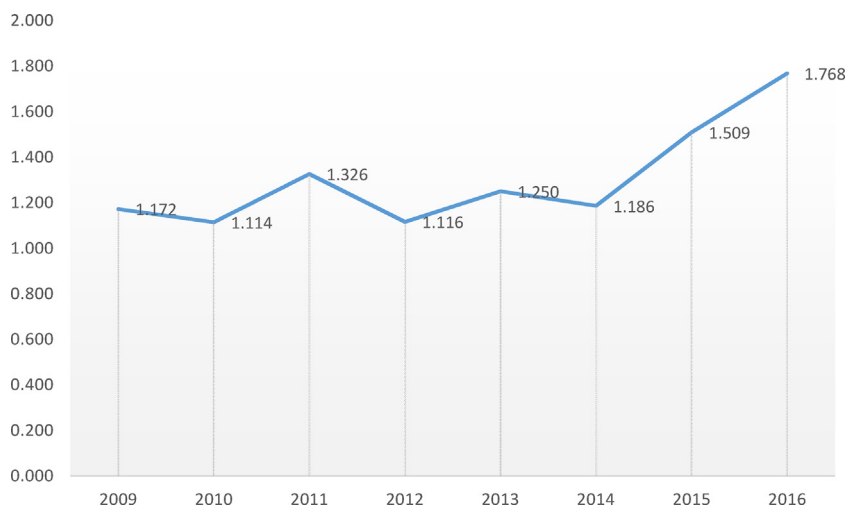
Figura 2. Evolución del factor de impacto.

cer cuartil en los índices del Science Citation Index, concretamente en el lugar 94 de 173, y en el segundo cuartil (lugar 67 de 157) en el Social Sciences Citation Index en la clasificación Public, Environmental & Occupational Health del Journal Citation Reports, siendo la primera revista en lengua distinta del inglés de esta categoría para ese mismo año.