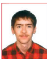
Pau Roigé Comunicació Audiovisual

“El fet que la facultat sigui petita ha afavorit que hi hagi molt bon rotllo entre els companys, ens coneixem entre tots. A més a més, aquest grau aporta una visió de laboratori més àmplia que en altres facultats, i això m'ha agradat molt”.